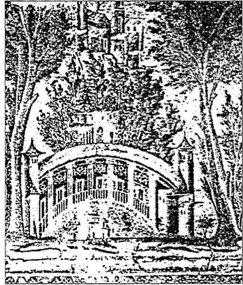
شکل دو: صفحه براد در مسجد جامع دمشق

خوش یمن در باغ ایرانی است. چرا که در ایران باستان اعتقاد بر این بوده است که جهان در چهار بخش آفریده شده است و عناصر اصلی پیدایی جهان چهار می باشند.